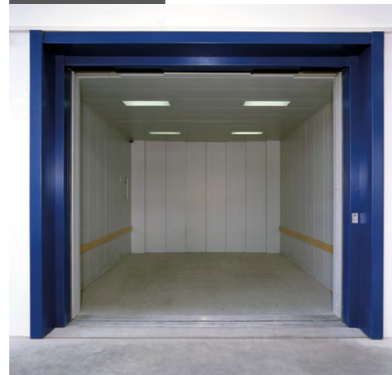
↘ Lastenaufzug OLYMPUS, produzierendes Unternehmen

Wir wissen, dass die Bedürfnisse unserer Kunden vielfältig sein können. Wir sind ein erfahrener Partner für die Implementierung neuer Industrielösungen. Deshalb sind wir stets bereit zuzuhören, mit Unternehmen zusammenzuarbeiten und ihnen dabei zu helfen, mit Lödige-Lösungen ihre Leistung zu verbessern. Neben dem OLYMPUS bieten wir auch maßgeschneiderte Lastenaufzugslösungen an.