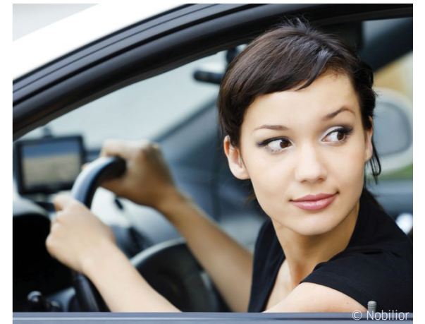
Autoaufzug, CarLoft GmbH Berlin, Mehrfamilienhaus