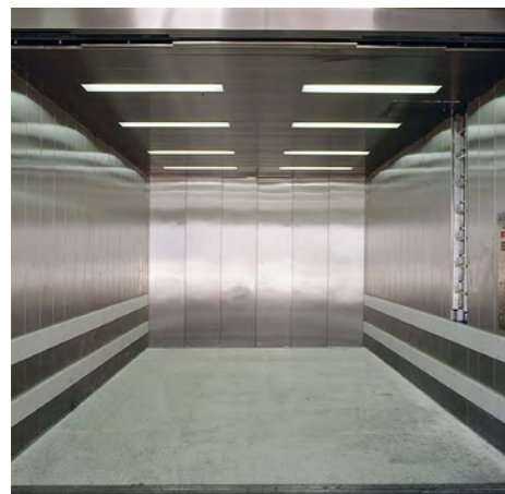
↖ Lastenaufzug OLYMPUS, Messegelände

Das Baukasten-Konzept ermöglicht verschiedene Ausführungen, je nach Anwendungsprofil und baulichen Gegebenheiten.