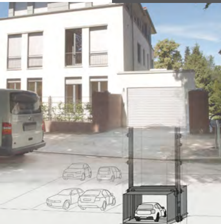
Autoaufzug PEGASOS®, privates Gebäude

Wir berücksichtigen Ihre individuellen Bedürfnisse und Gestaltungswünsche, entwickeln platzsparende und sichere Lösungen für den Innen- und Außenbereich und bieten so eine perfekte Integration von Autoaufzügen in Neu- und Umbauten.