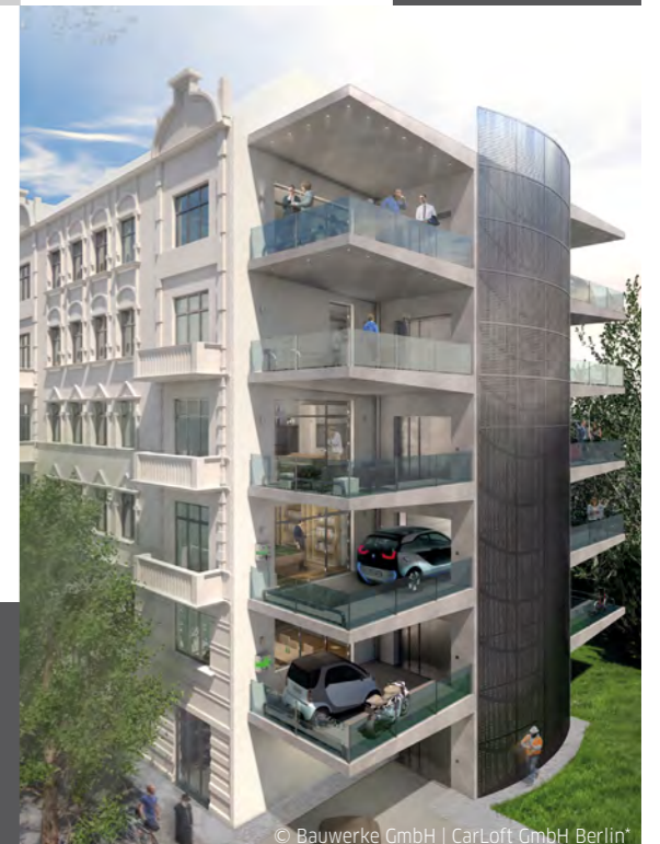
© Bauwerke GmbH | CarLoft GmbH Berlin