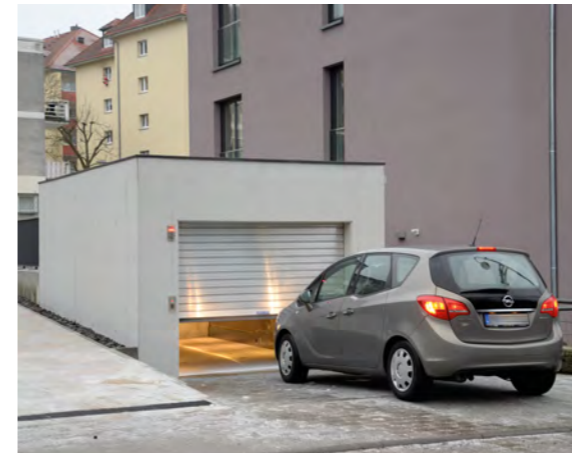
Autoaufzug PEGASOS®, privates Gebäude