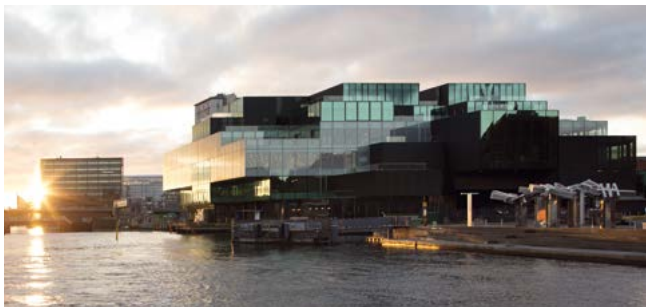
BLOX, Kopenhagen, Dänemark, 350 PKW, öffentlich