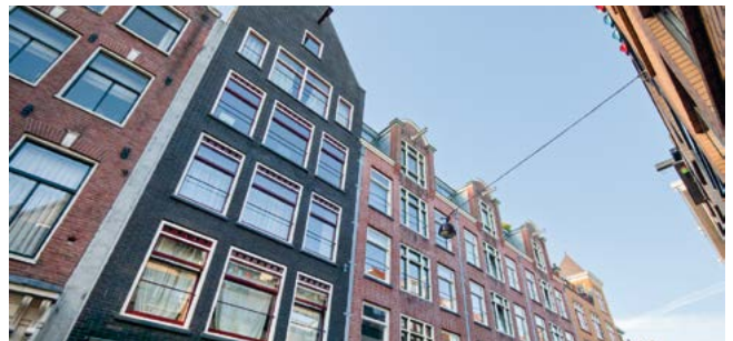
Herengracht, Amsterdam, Niederlande, 44 PKW, Mixed-Use