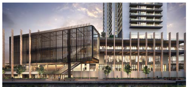
The Lennox, Sydney, Australien, 374 PKW, Wohngebäude