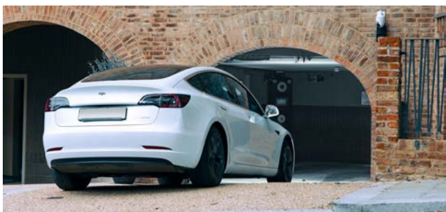
Fitzjohn Ave., London, UK, 29 PKW, Wohngebäude