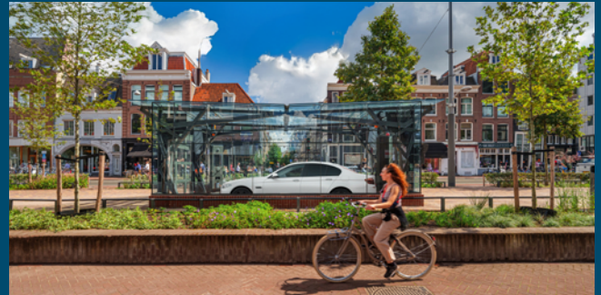
RESPACE® Hybrid: Vijzelgracht, Amsterdam, 270 Plätze, teils öffentlich