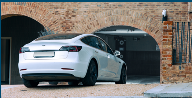
RESPACE E-PUZZLE®: Fitzjohn Ave., London, 29 Plätze, privat