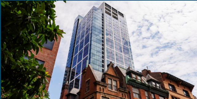
RESPACE E-PUZZLE®: Midwood, Philadelphia, 90 Plätze, privat