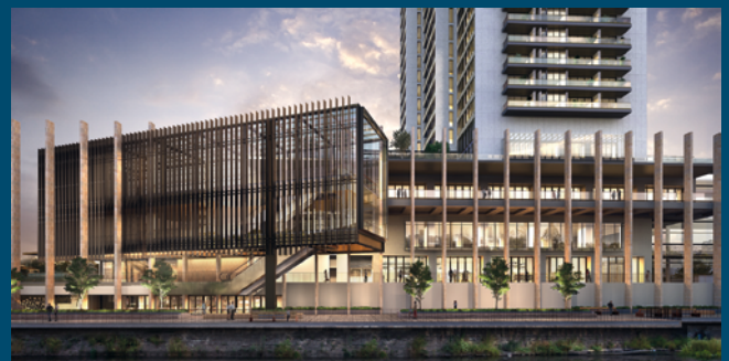
RESPACE SHIFTER®: The Lennox, Sydney, 327 Plätze, privat